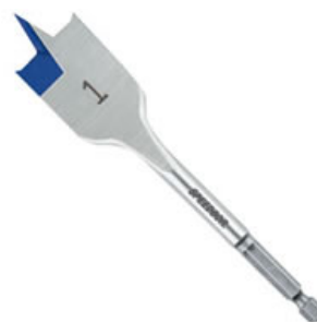
Mèches à centre plats