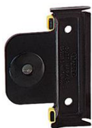
Marqueur à penture