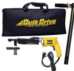
Visseuse à plancher